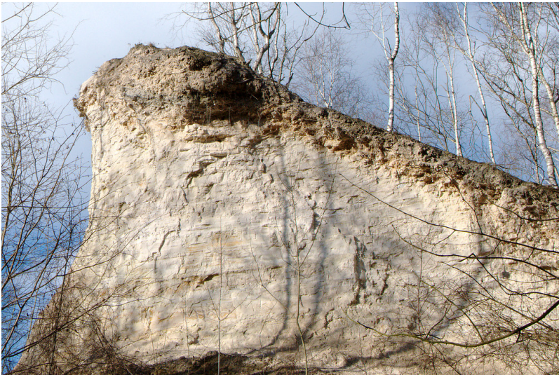
Kalkhalde Teuterhof im Wurmatal (2015)