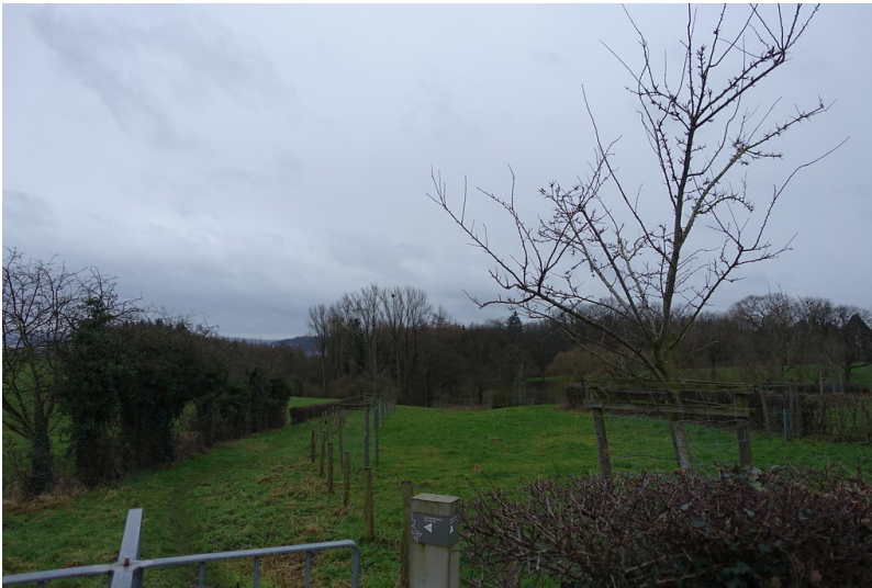
Blick auf den Landschaftsgarten von Haus Ferber und Haus Berensberg (2015)