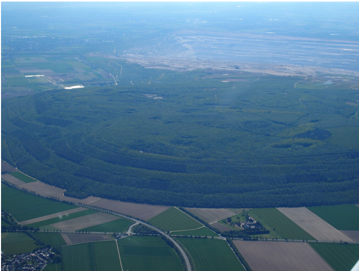
Sophienhöhe (2021)