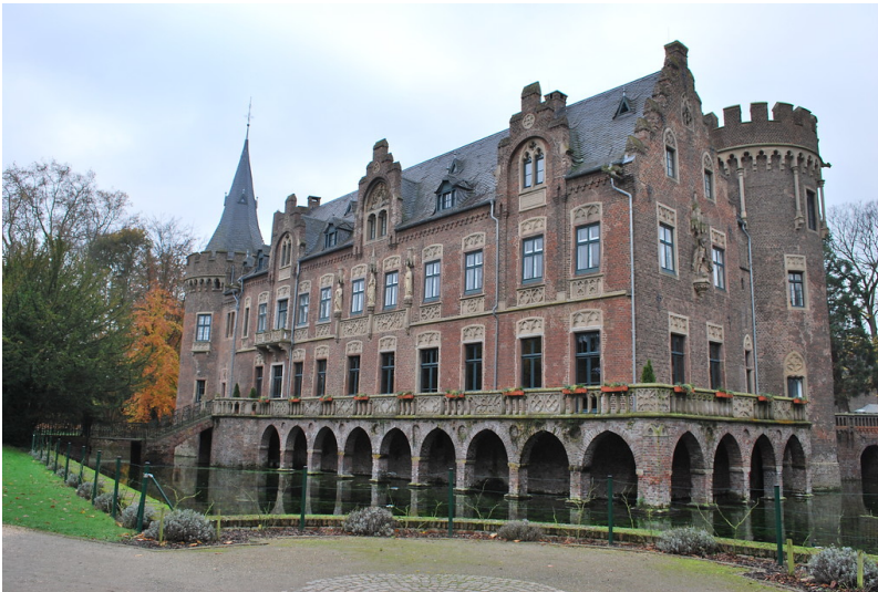
Gartenansicht von Schloss Paffendorf (2014)