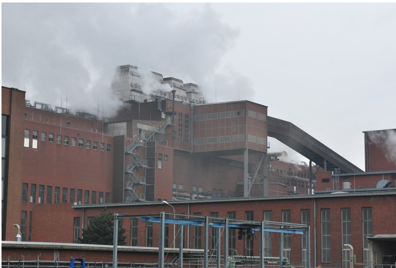
Brikettfabrik Fortuna im Jahr 2014