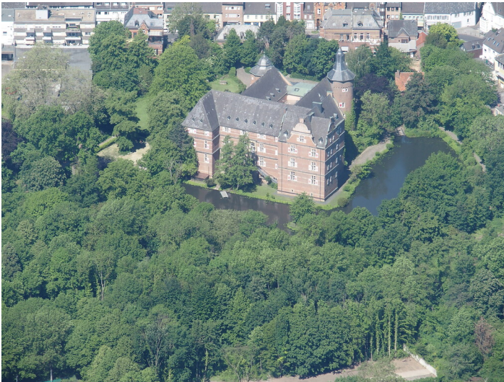
Schloss Bedburg (2021)