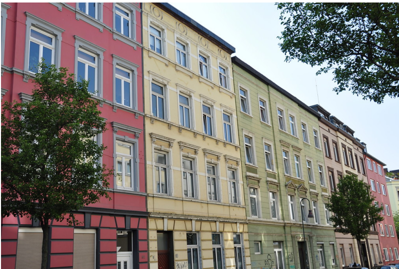
Aachen Ostviertel (2014)