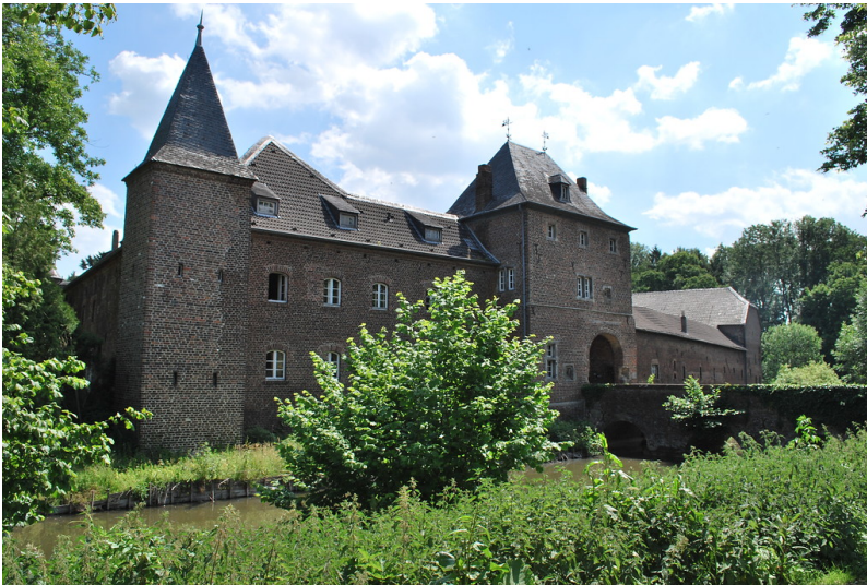
Die Vorburg von Schloss Kellenberg besitzt einen Eckturm mit spitzem Dach und mittig ein Torhaus mit Walmdach. Über den Wassergraben führt eine steinerne Brücke auf das Torhaus zu (2015).