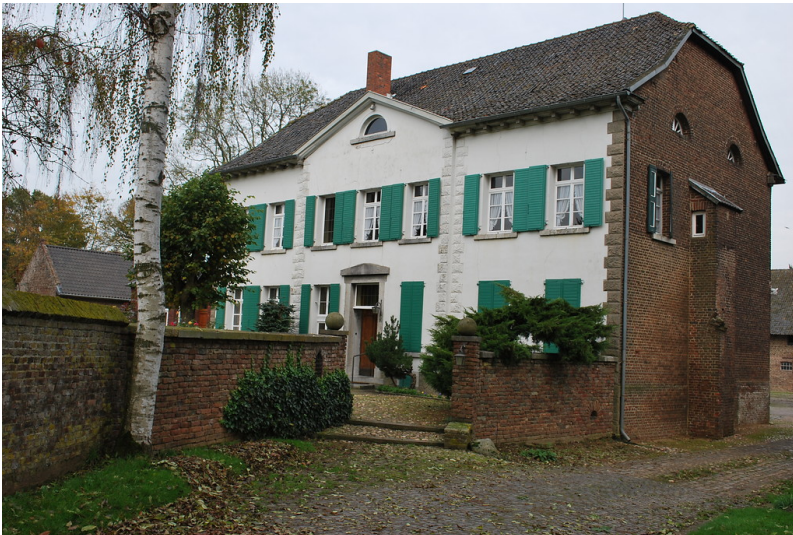
Meerhof (2014)