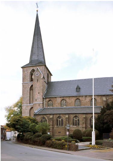
Waldfeucht, Denkmalsbereich Historischer Ortskern