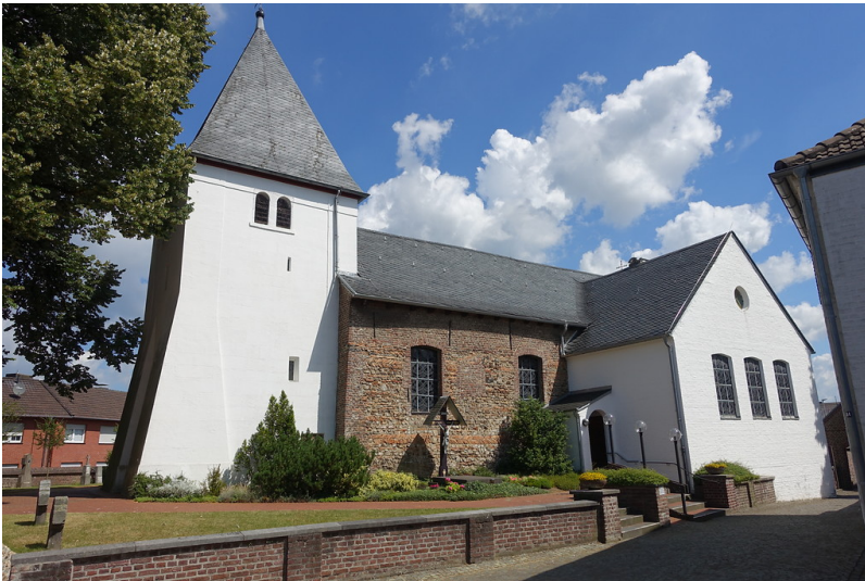
Kirche St. Martin in Orsbeck (2016)