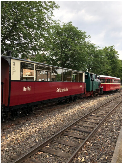
Selfkantbahn (2023)