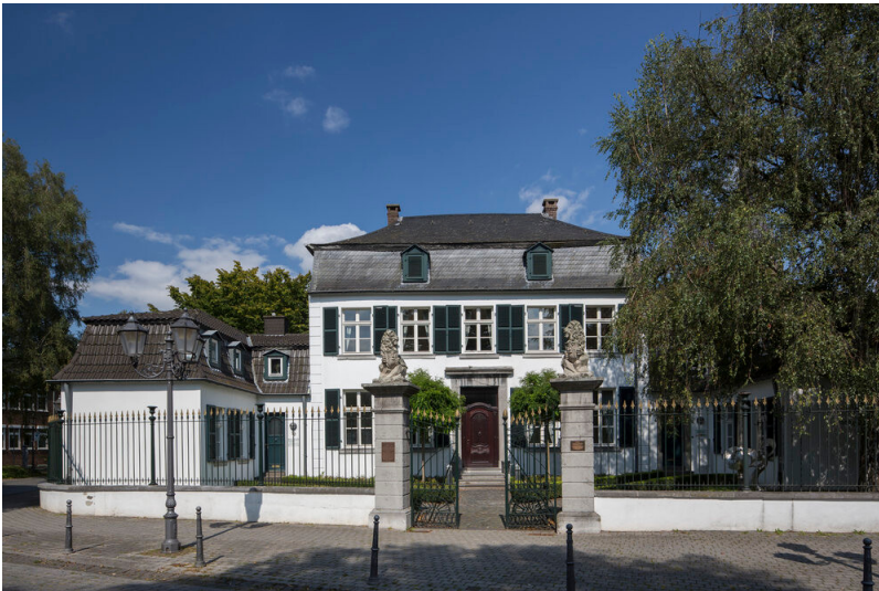
Haus Spiess in Erkelenz (2014)