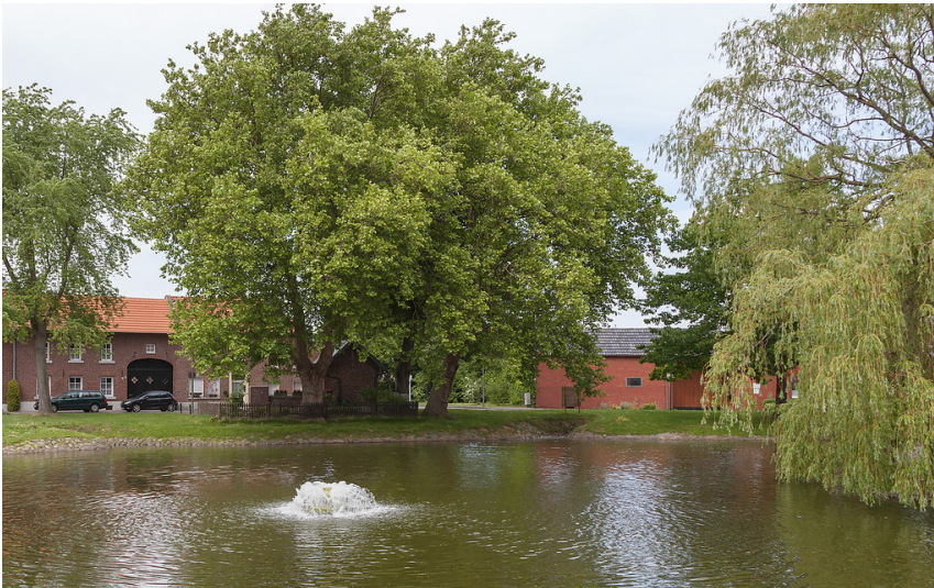
Erkelenz-Bellinghoven, Dorfansicht