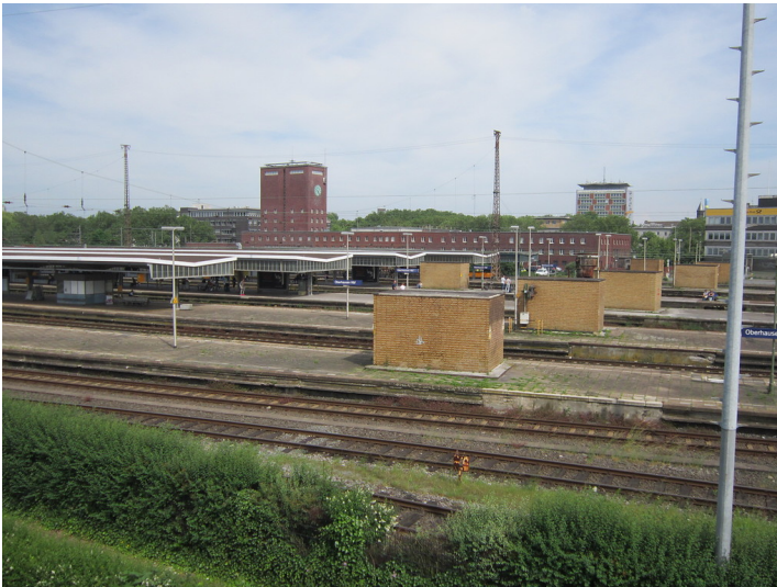
Oberhausen Hauptbahnhof, Blick über das südliche Gleisfeld mit den ehemaligen Gepäckaufzügen (2016)