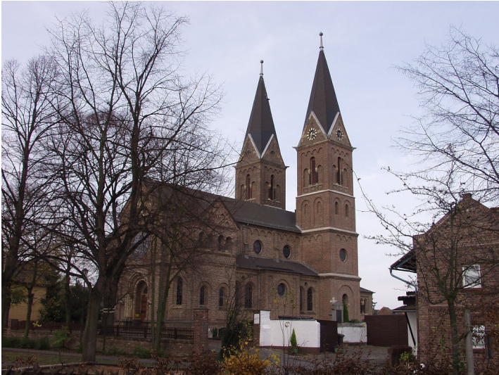
St. Jakobus, Jakobwüllesheim