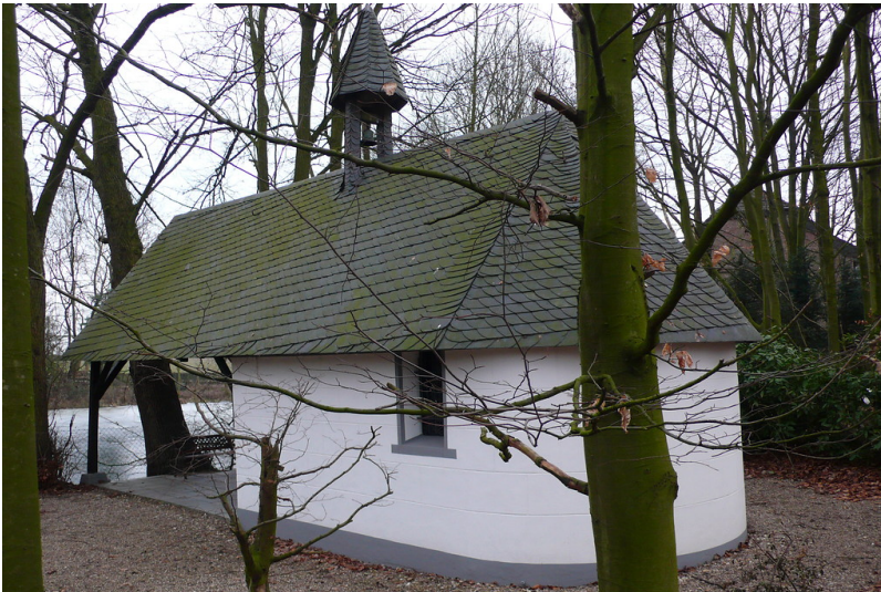
Kapelle am Hahnerhof