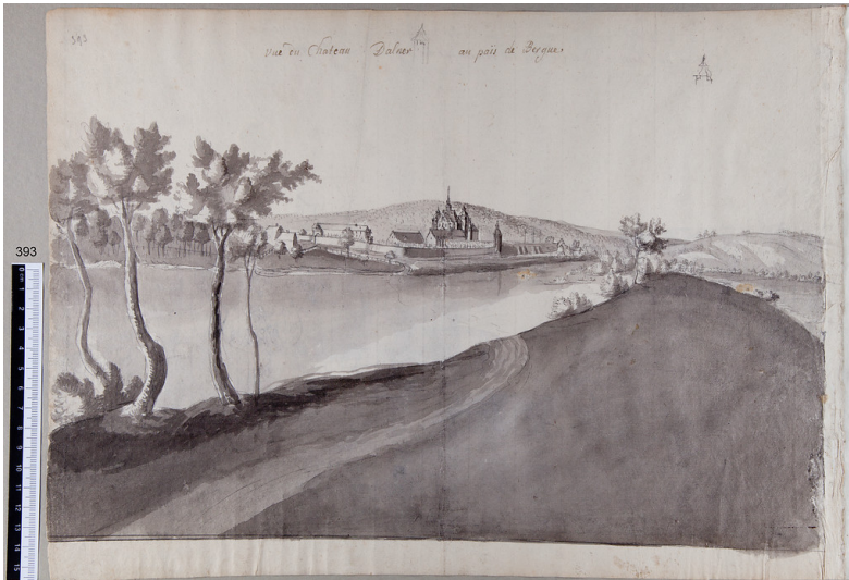
Hennef-Allner, Ortsansicht mit Schloss Allner, Zeichnung von Renier Roidkin Fotograf/Urheber: Renier Roidkin