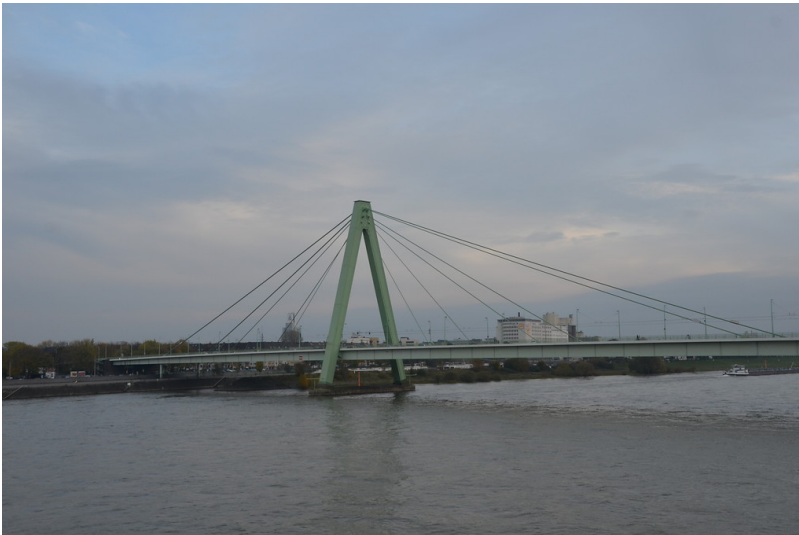
Die Severinsbrücke und das rechte Rheinufer in Köln (2013)