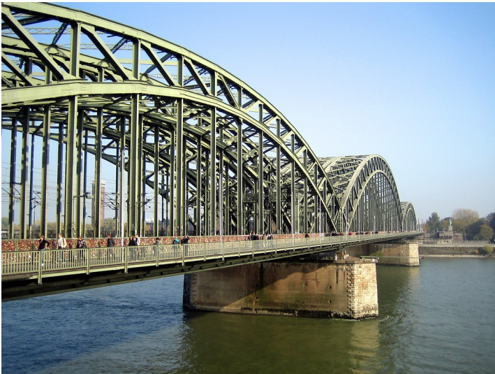
Die Hohenzollernbrücke in Köln von der linken Rheinseite aus (2012).