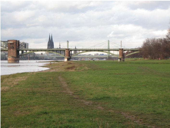
Die Kölner Südbrücke, hier die drei Bögen der Vorlandbrücke auf der rechten, östlichen Rheinseite (2014).