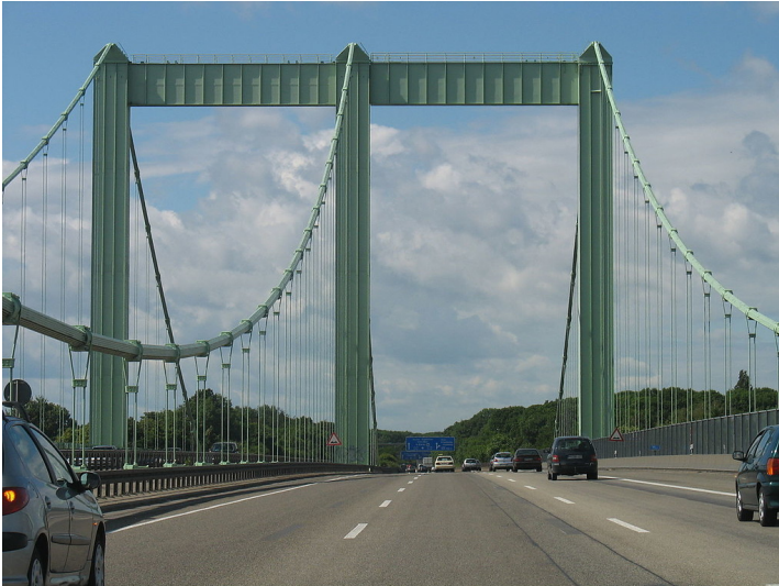
Die Rodenkirchener Autobahnbrücke über den Rhein, Aufnahme von der Autobahn A 4 aus in Fahrtrichtung Westen (2009)