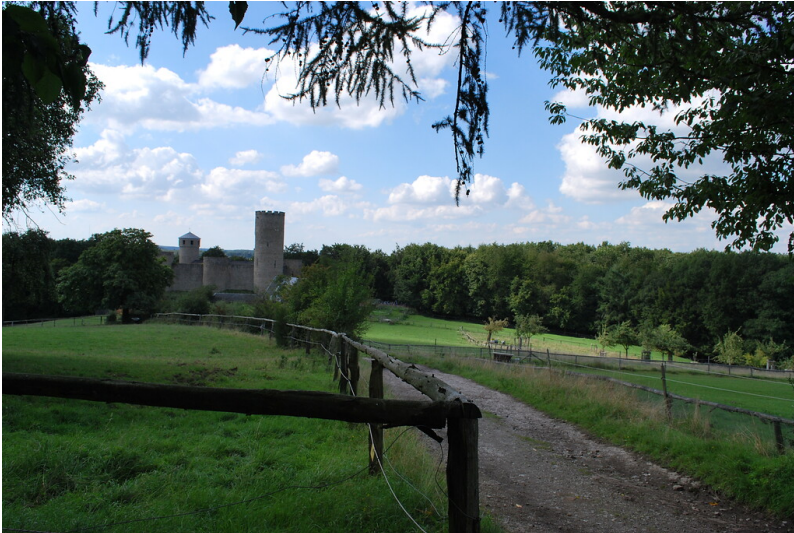
Restaurierte Laufenburg bei Langerwehe und umliegende Ländereien (2015)