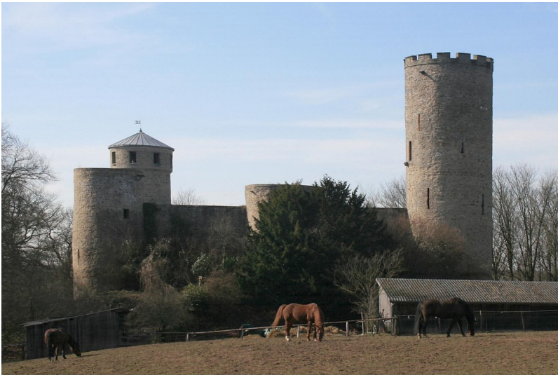
Laufenburg in Langerwehe