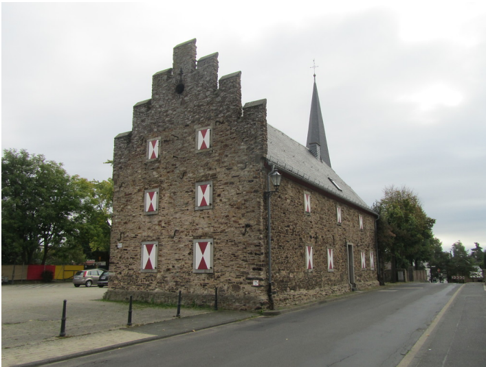
Zehnthaus in Odendorf (2014)