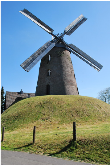
Windmühle in Pulheim-Stommeln (2014)