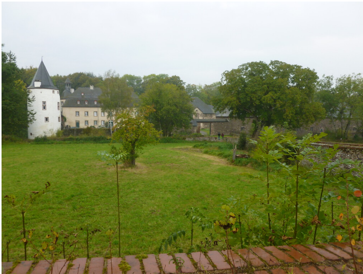
Hauptgebäude der Burg Dreiborn mit Rundturm (2014)