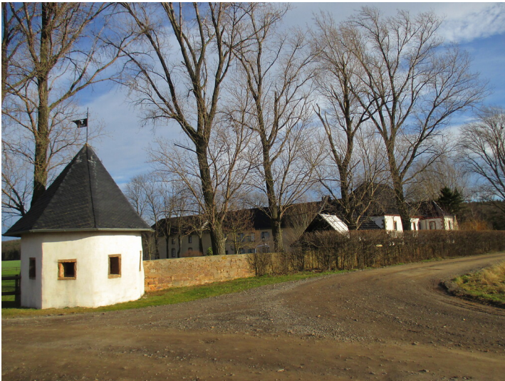
Kloster Antonigartzem (2015)