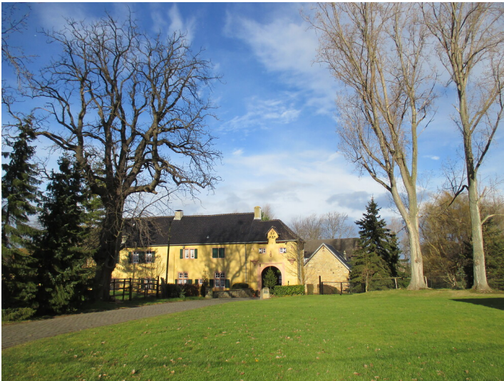
Burg Irnich (2015)