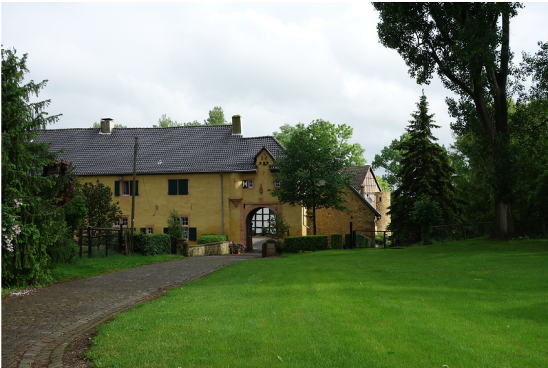
Burganlage des 14.-19. Jahrhunderts, umgeben von altem Baumbestand; Alleinlage in der Bördelandschaft (2016)