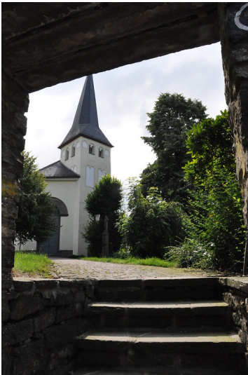
Blick vom "Burghof" auf die Pfarrkirche St. Laurentius, Hohkeppel (2014)