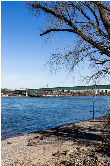
Zoobrücke in Köln (2021)