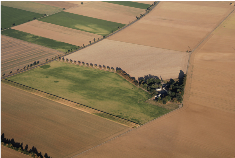
Gut Dirlau in Vettweiß von Nordwesten (2016)