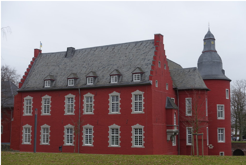
Burg Alsdorf (2015)