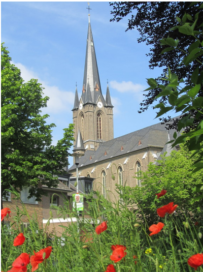
St. Dionysius in Gleuel (2014)