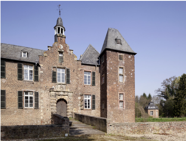
Haus Rath (2015)