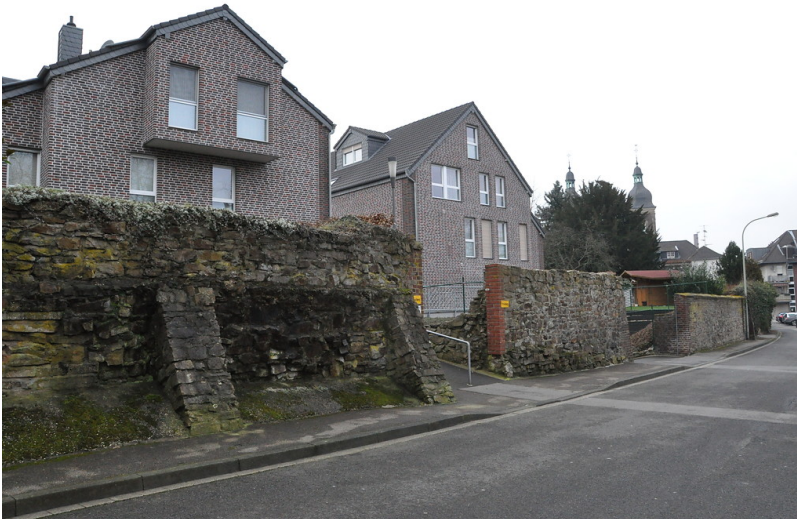
Reste der Stadtumwehrung von Herzogenrath (2015)