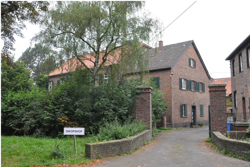
Toreinfahrt zum Dickopshof (2014)