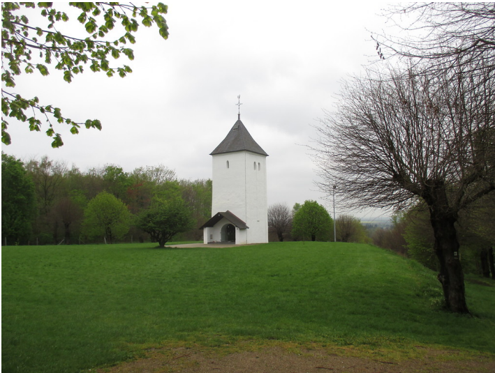
Swisterturm (2015)