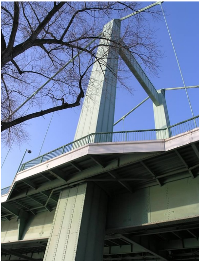
Die um die Pfeiler herumgeführten Fußgänger- und Radwege an der Mülheimer Brücke in Köln (2006)