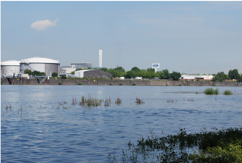
Blick aus der Flittarder Rheinaue auf das linksrheinische Hochufer mit den Ford-Werken im Norden von Köln-Niehl (2014).