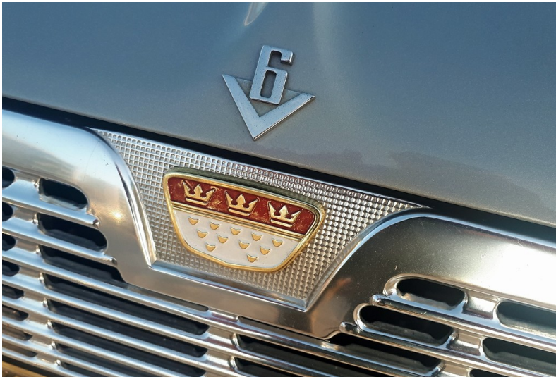
Das 1953-1967 verwendete Emblem der Ford-Werke AG mit Elementen des Kölner Stadtwappens an der Front eines Ford Taunus 20M/P5 (2019).