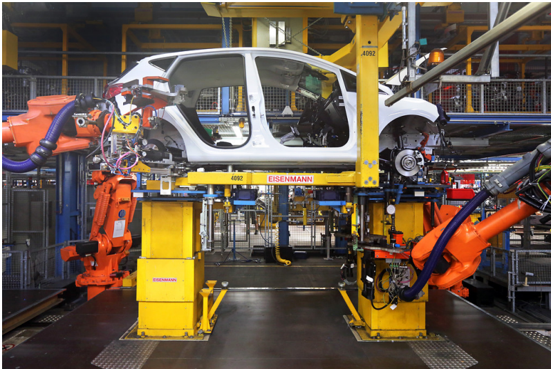
Fließbandproduktion des Ford Fiesta im Köln-Niehl Ford-Werk (2017), Roboter unterstützen die Montage der Fahrzeuge.