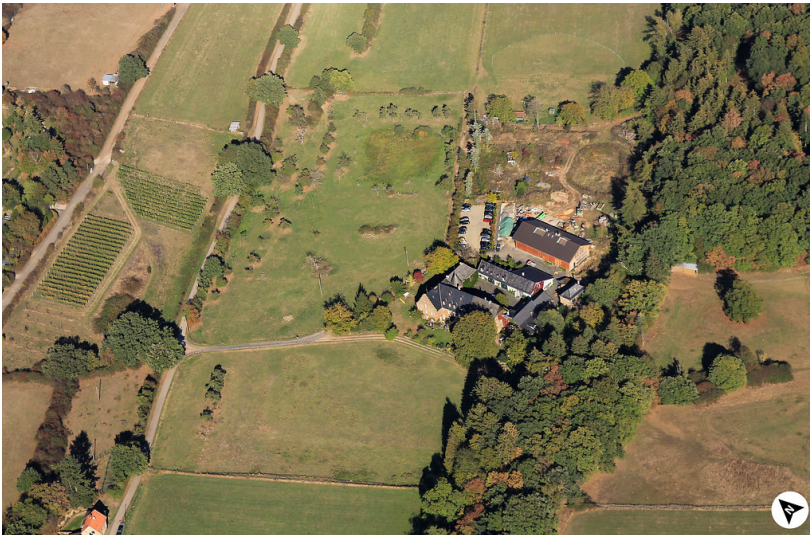
Luftbildaufnahme des Klosters Schweinheim mit Nordpfeil (2018)