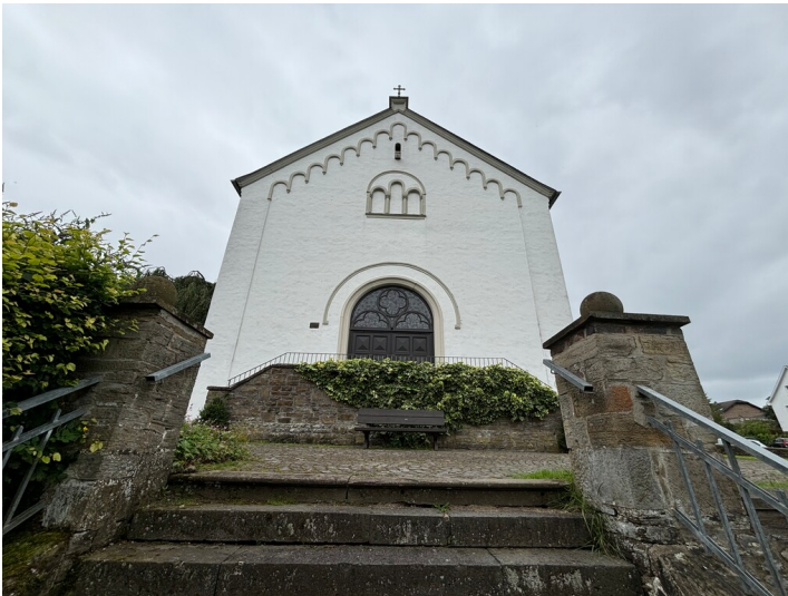
Eingangsportal der Kirche in Honrath (2024)