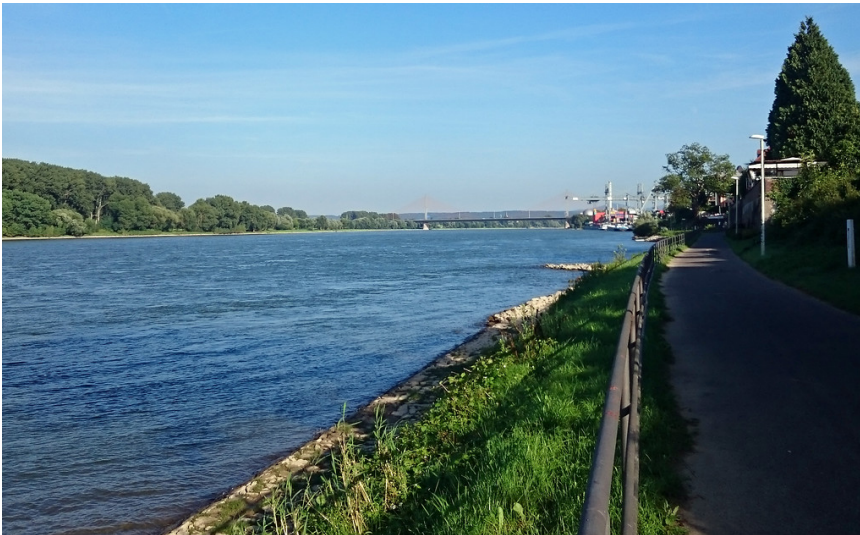
Blick auf den Rhein vom Graurheindorfer Ufer aus Richtung Süden (2016). Im Hintergrund sind der Bonner Hafen und die Friedrich-Ebert-Brücke zu sehen.