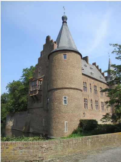
Burg Konradsheim (2015)