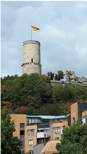
Ansicht der Godesburg von Bad Godesberg aus (2018).