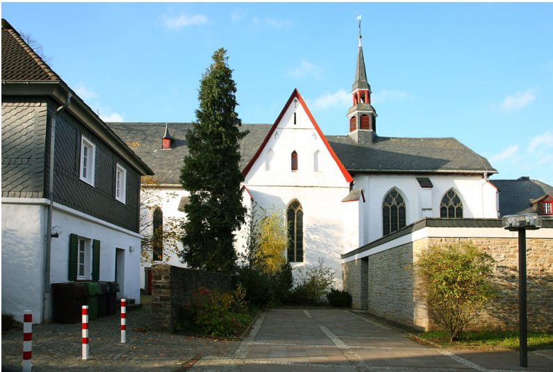
Wallfahrtskirche St. Mariä Heimsuchung im Kloster Marienheide (2008)