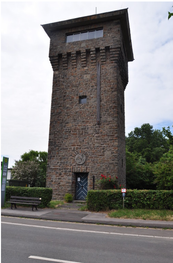
Hindenburgturm in Ketzbergerhöhe in Wermelskirchen (2015)