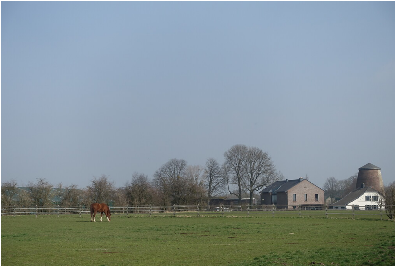
Windmühle Vetschau (2015)